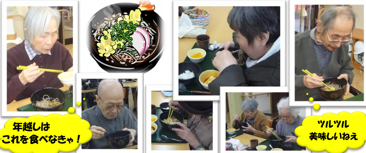
年越しは これを食べなきゃ!