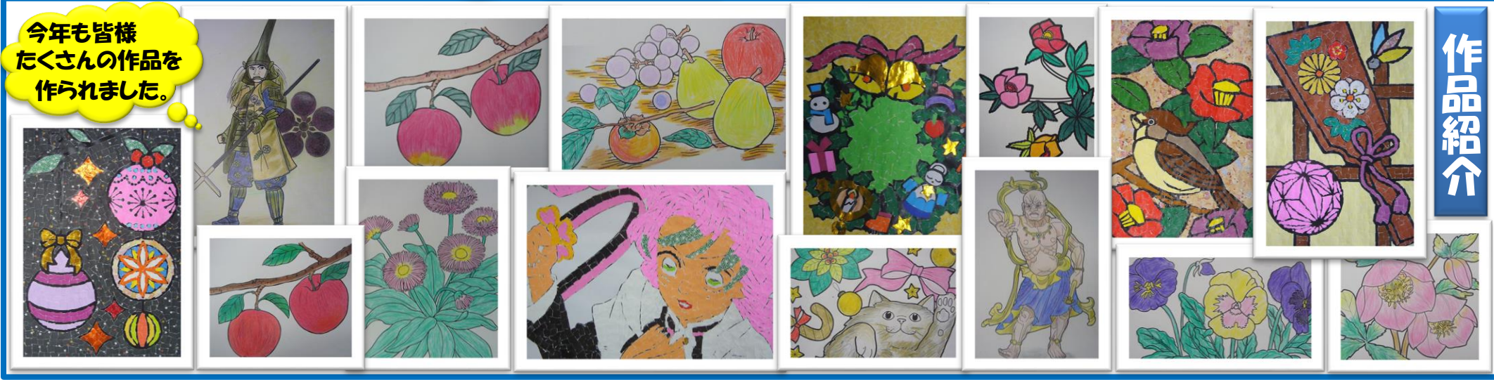
今年も皆様 たくさんの作品を 作られました。